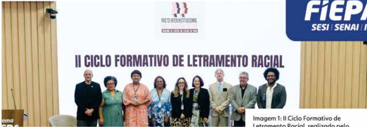
Imagem 1: II Ciclo Formativo de Letramento Racial, realizado pelo Sistema FIEPA