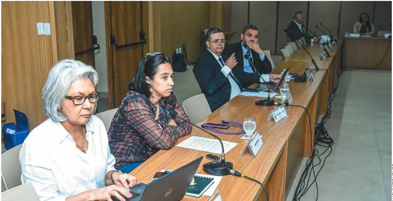
UCHOIA SILVA / TJPA

Marabá e Santarém e a destinação de terras federais a municípios como Capitão Poço, Cachoeira do Piríá, Irituia, Mãe do Rio e Tomé-Açu.