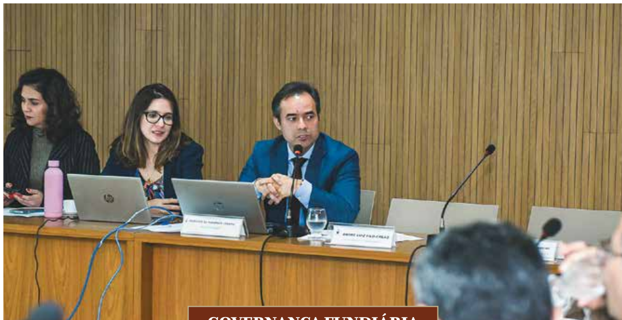
UCHOA SILVA / TJPA