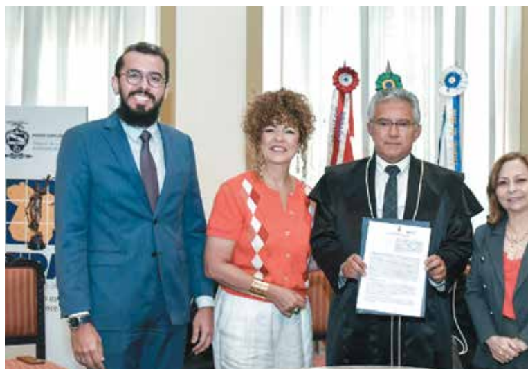
Projeto do TJPA tem a parceria da Academia Paraense de Música (APM).