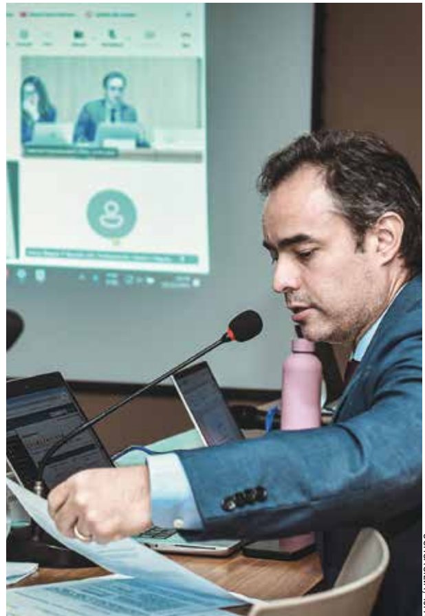
UCHOIA SILVA / TJPA

TJPA promove rodada de reuniões do Grupo de Governança Fundiária.