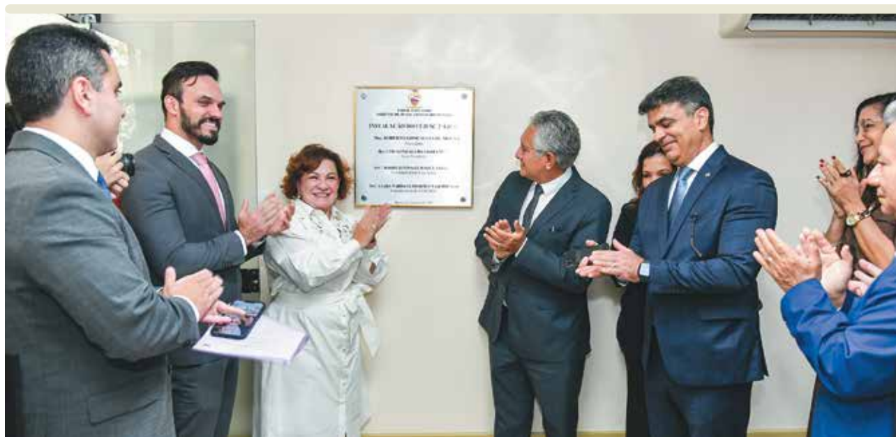
ERIKA MIRANDA / TJPA

Inauguração do Cejusc do 2º Grau, com instalações no TJPA e extensão na Unama.