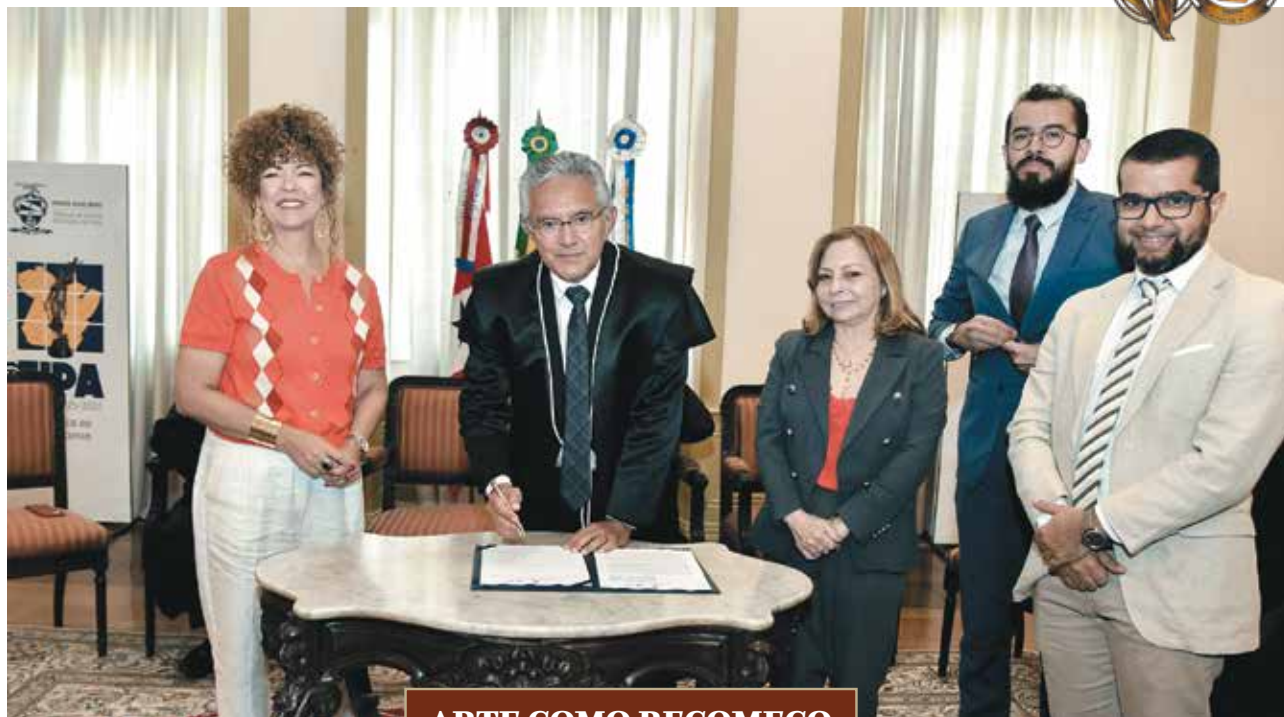
ARTE COMO RECOMEÇO