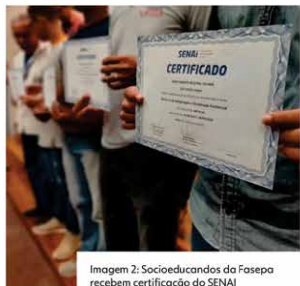
Imagem 2: Socioeducandos da Fasepa recebem certificação do SENAI

Essas ações refletem um compromisso contínuo com valores fundamentais ao Estado Democrático de Direito: dignidade, igualdade de oportunidades e responsabilidade social.